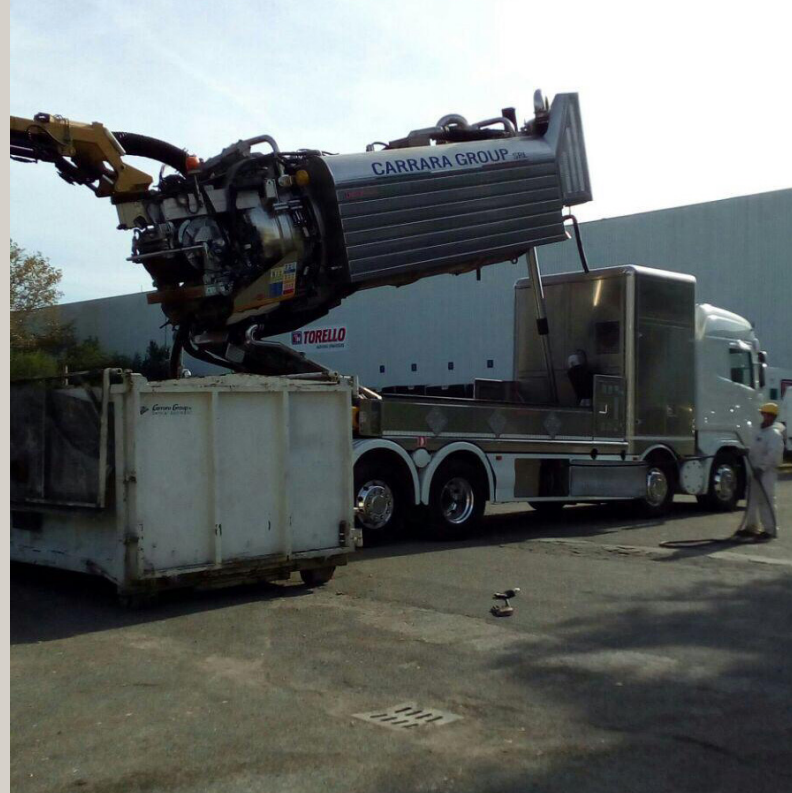
Scarico sabbie e polveri in cassoni