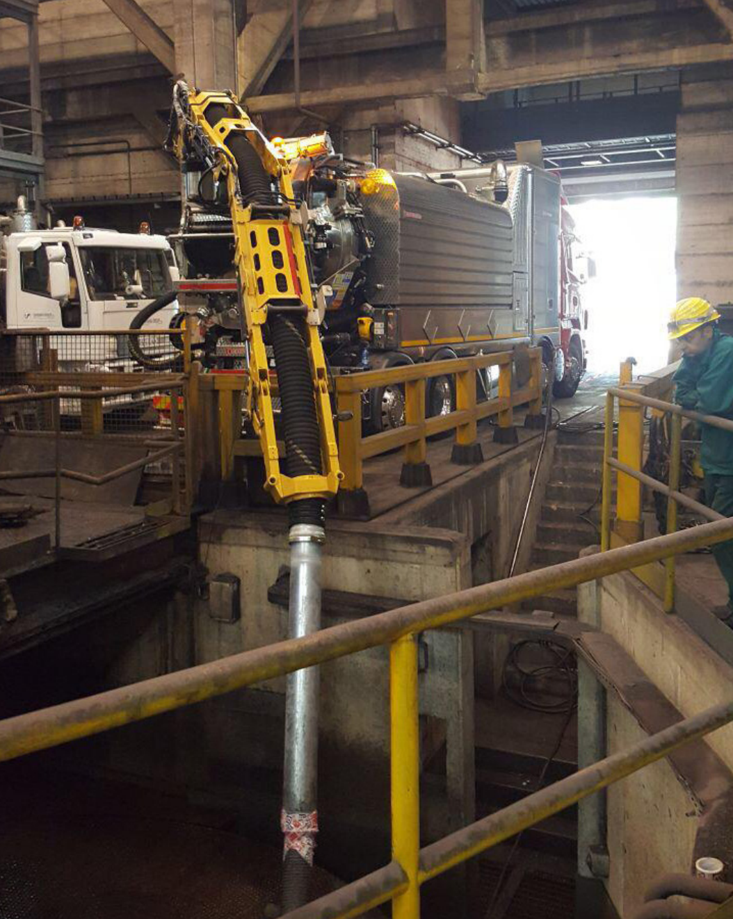
Aspirazioni industriali di scorie e polveri