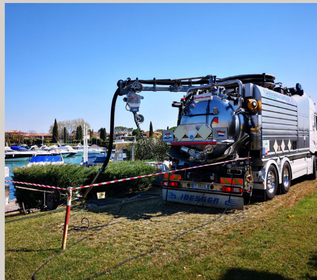
Bonifica cisterne gasolio e benzine