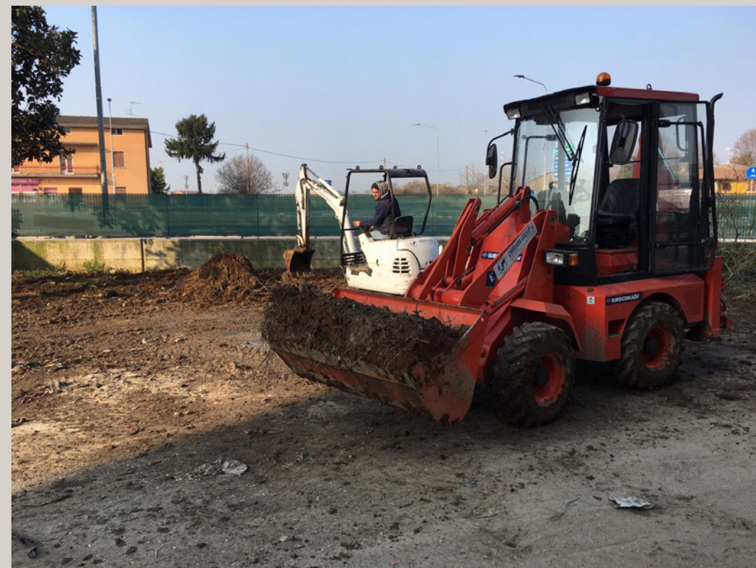
Bonifica terre e sversamento liquidi