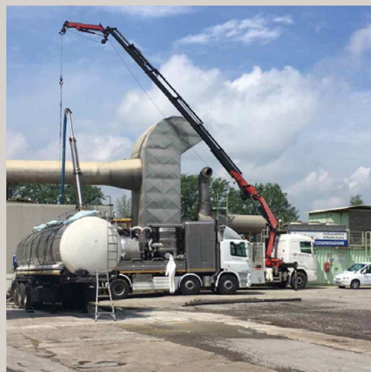
Cisterne a noleggio riscaldate per svuotamento e bonifica serbatoio di paraffine