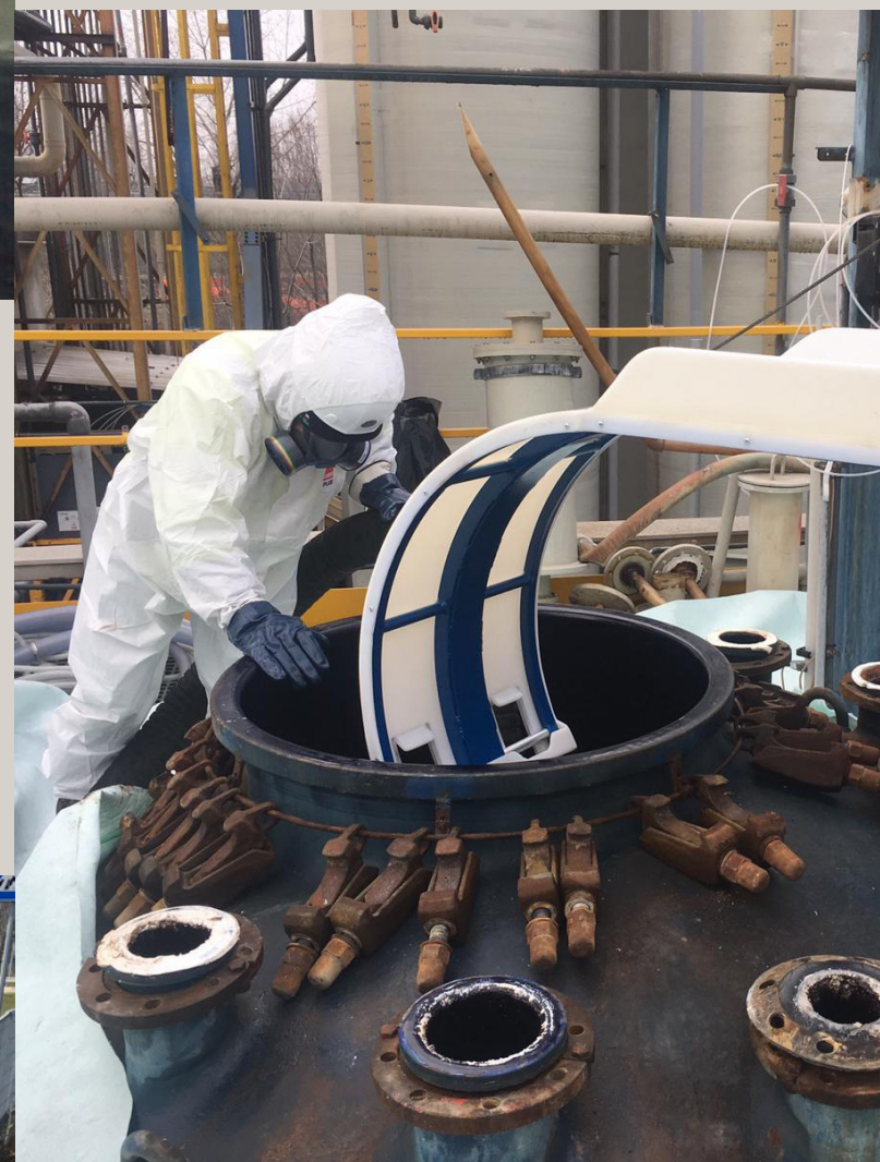
Bonifica serbatoi in spazi confinati