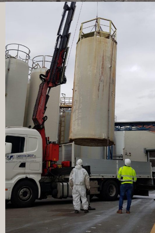
Bonifica ed estrazione sylos