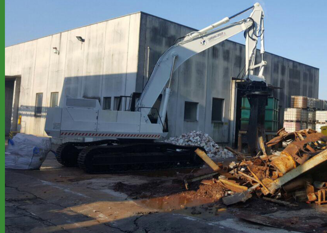
Demolizione sylos, forni e separazione refrattari