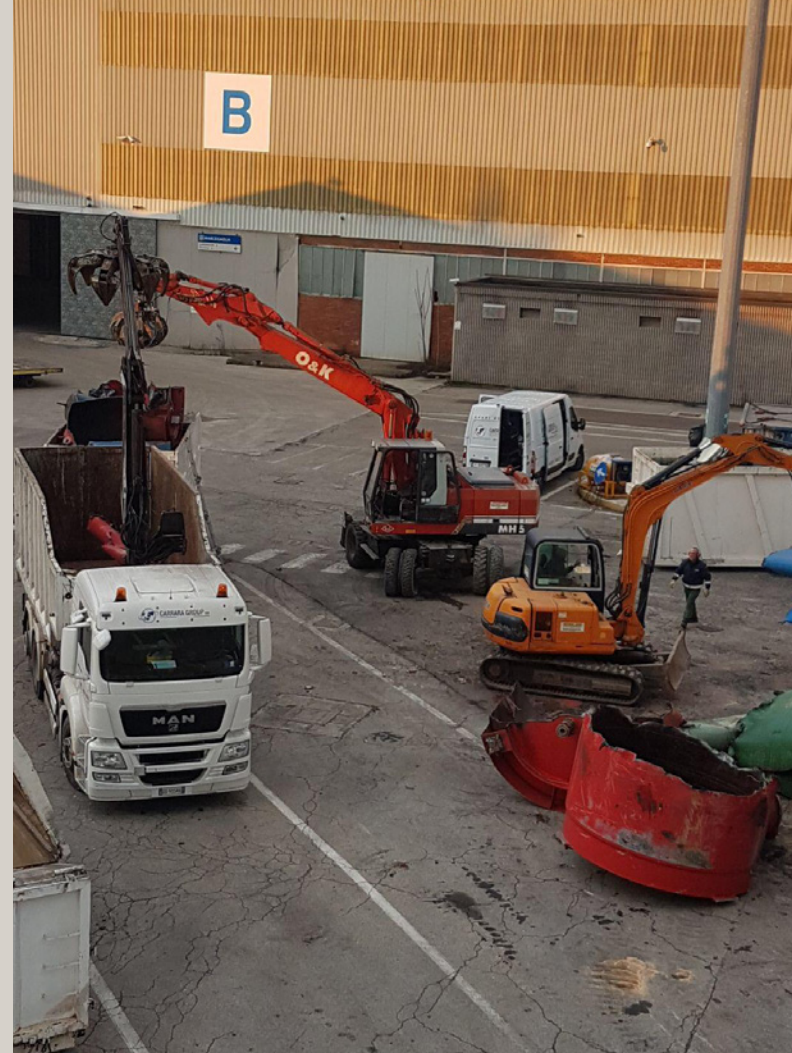
Bonifica e demolizione serbatoi