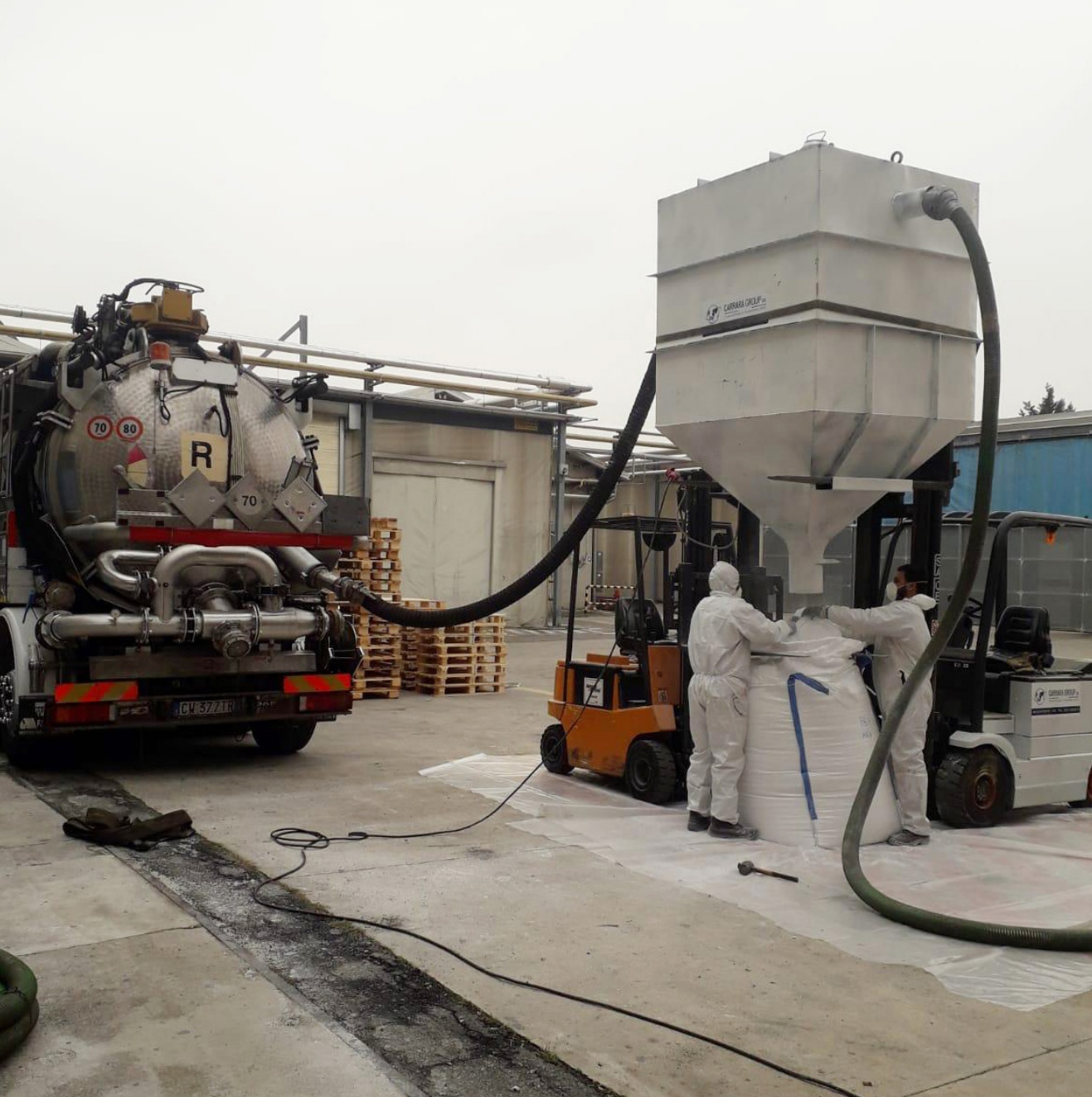
Aspirazione e insaccamento polveri