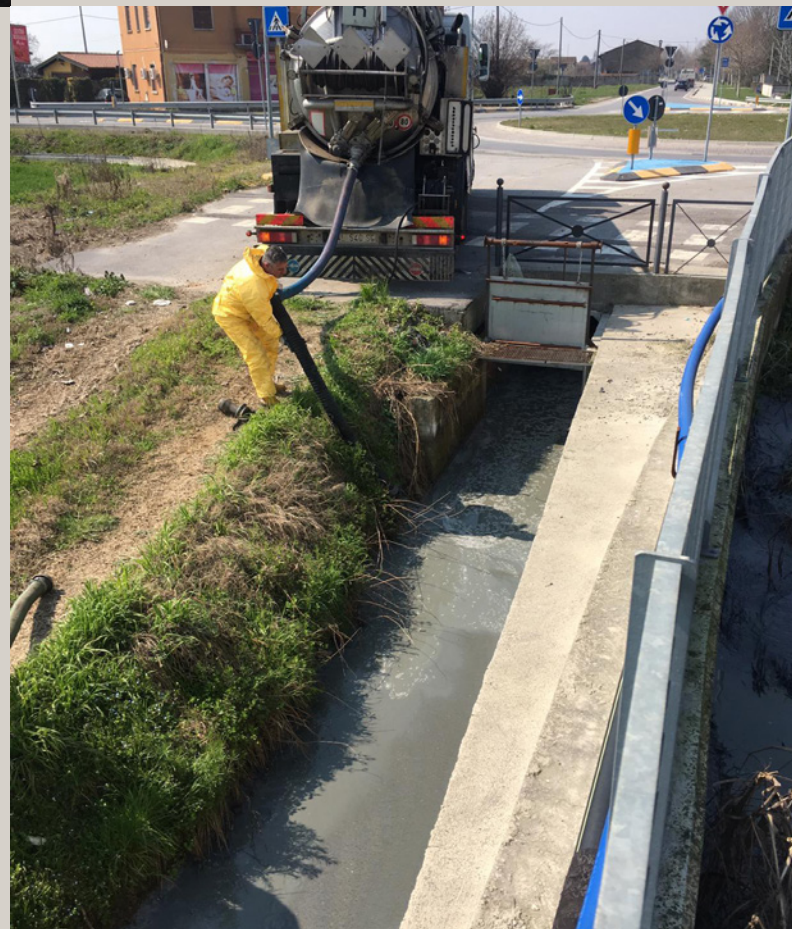
Aspirazione e pulizia rogge