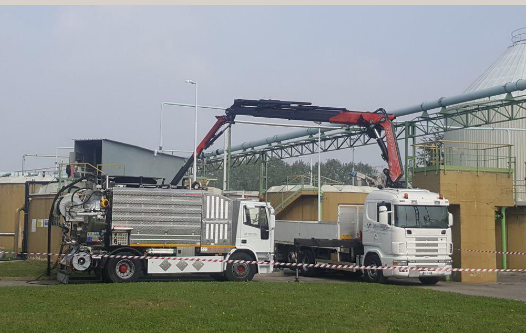
Bonifica vasche senza accesso in vasca